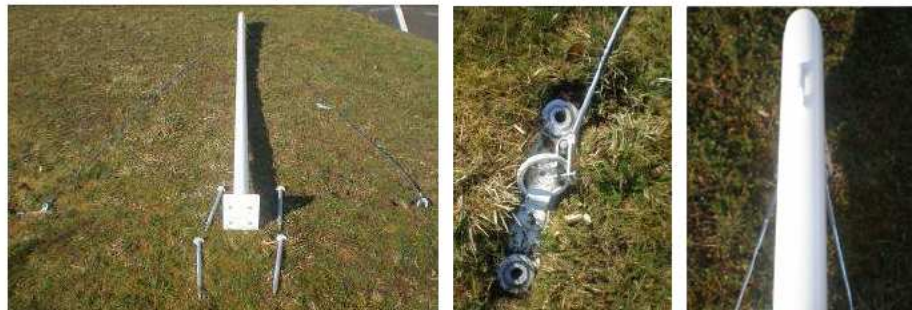
Passant libre du haut du mât coté ciel.

Attention les mâts doivent être positionnés couchés avec le dernier passant libre du haut du mât coté ciel.