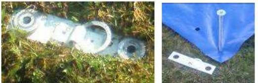
4 Platines pour cotes câbles et mâts (sur grande bande du gabarit) PLATINE AVEC ANNEAU ROND MOBILE