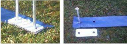
2 platines pour cotés bas de pointe toile (sur petite bande du gabarit) PLATINE AVEC PASSANT RECTANGULAIRE FIXE