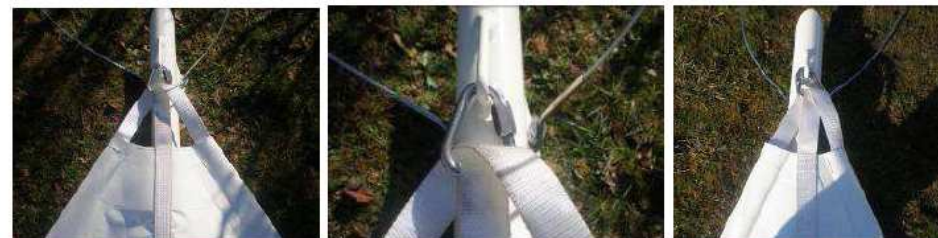
POINTE LARGE AU PETIT MAT

- REPERER LA POINTE LA PLUS LARGE ET L'ACCROCHER À L'ANNEAU DU PETIT MÂT À L'AIDE DE L'ANNEAU DELTA FIXE SUR LA SANGLE.