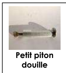
Petit piton douille