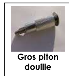
Gros piton douille