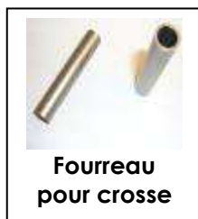
Fourreau pour crosse