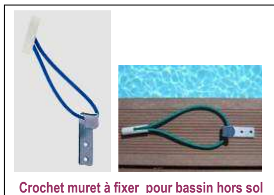
Crochet muret à fixer pour bassin hors sol