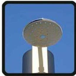
aspersoir (photo 2)