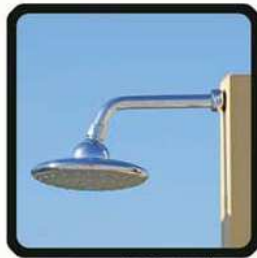
aspersoir (photo 1)