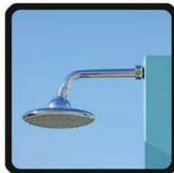
aspersoir (photo 1)