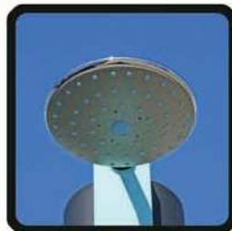
aspersoir (photo 2)