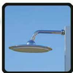
aspersoir (photo 1)