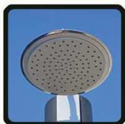
aspersoir (photo 2)