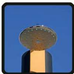
aspersoir (photo 2)