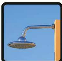
aspersoir (photo 1)