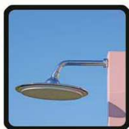
aspersoir (photo 1)