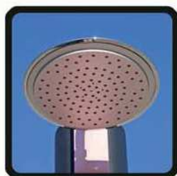
aspersoir (photo 2)