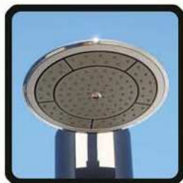
aspersoir (photo 2)