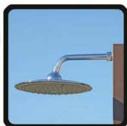
aspersoir (photo 1)