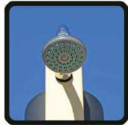
aspersoir (photo 2)