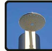
aspersoir (photo 2)