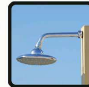
aspersoir (photo 1)