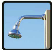
aspersoir (photo 1)