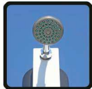
aspersoir (photo 2)