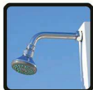
aspersoir (photo 1)