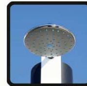
aspersoir (photo 2)