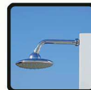
aspersoir (photo 1)