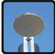
aspersoir (photo 2)