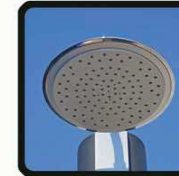
aspersoir (photo 2)