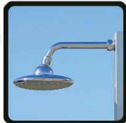
aspersoir (photo 1)