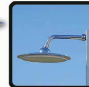
aspersoir (photo 1)