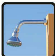
aspersoir (photo 1)