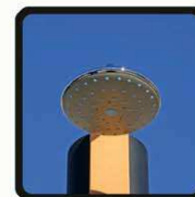
aspersoir (photo 2)