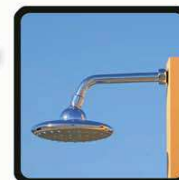
aspersoir (photo 1)