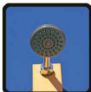
aspersoir (photo 2)