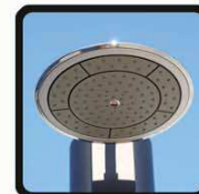
aspersoir (photo 2)