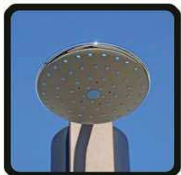
aspersoir (photo 2)