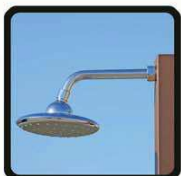
aspersoir (photo 1)