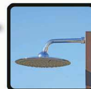
aspersoir (photo 1)