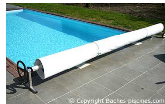
Bachette de protection