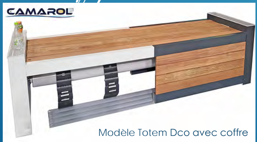
Modèle Totem Dco avec coffre

LNE : K030698/DE/4 du 13/11/2009 SGS : RES 231762 01C- Rev1 du 05/05/2023